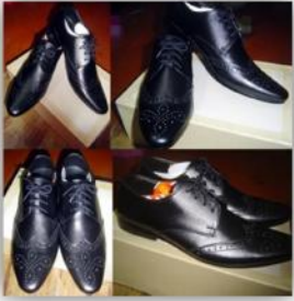
ห้ามสวมรองเท้ามีลวดลาย หรือแบบที่มีเชือกผูก