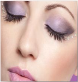
ห้ามติดขนตาปลอมยาวเกินจริง ห้ามแต่งหน้าจัดจ้าน