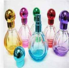
ห้ามฉีดน้ำหอม (ใช้ได้เฉพาะโรลออน)