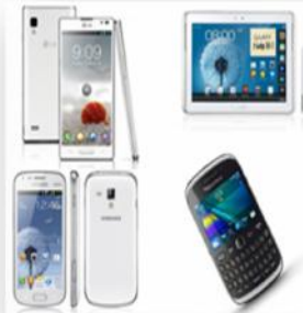
ห้ามพกอุปกรณ์สื่อสาร หรืออุปกรณ์อิเล็กทรอนิกส์ทุกชนิด

ไม่อนุญาตให้นำสิ่งของที่ไม่เกี่ยวข้องเข้าไปในห้องพิธี โดยเด็ดขาด โดยข้อปฏิบัตินี้ ขอให้บัณฑิตยึดปฏิบัติตั้งแต่วันแรกที่ซ้อม ณ วิทยาเขตหาดใหญ่ เป็นต้นไป เพื่อให้เกิดความคุ้นชิน และสามารถจัดระเบียบตัวเองได้เหมาะสม ถูกต้อง กับข้อปฏิบัติที่ทางมหาวิทยาลัยฯ กำหนดไว้