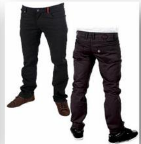
ห้ามสวมกางเกงยีนส์ กางเกงขาเดฟ