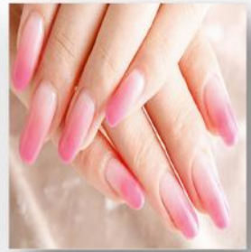
ห้ามทาสีเล็บ ผิดธรรมชาติ ต้องตัดเล็บให้สั้น เรียบร้อย