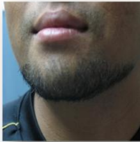
โกนหนวด เครา ให้เรียบร้อย