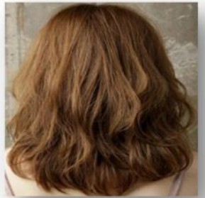
ห้ามทำสีผม ทำสีไฮไลต์