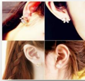
ห้ามใส่ต่างหู สร้อยคอ เครื่องประดับ เครื่องรางทุกชนิด