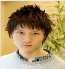
ห้ามทำผม ทรงแฟชั่น หรือฟู ไม่เรียบร้อย